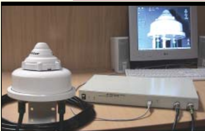
● Fig. 3. GSP1620x2 Customer Terminal for the High-Speed Transmission of Data (satellite modem made by Mikran Scientific Production).